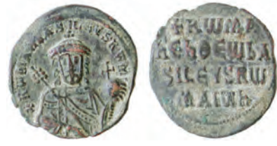
I. Romanus sikkesi