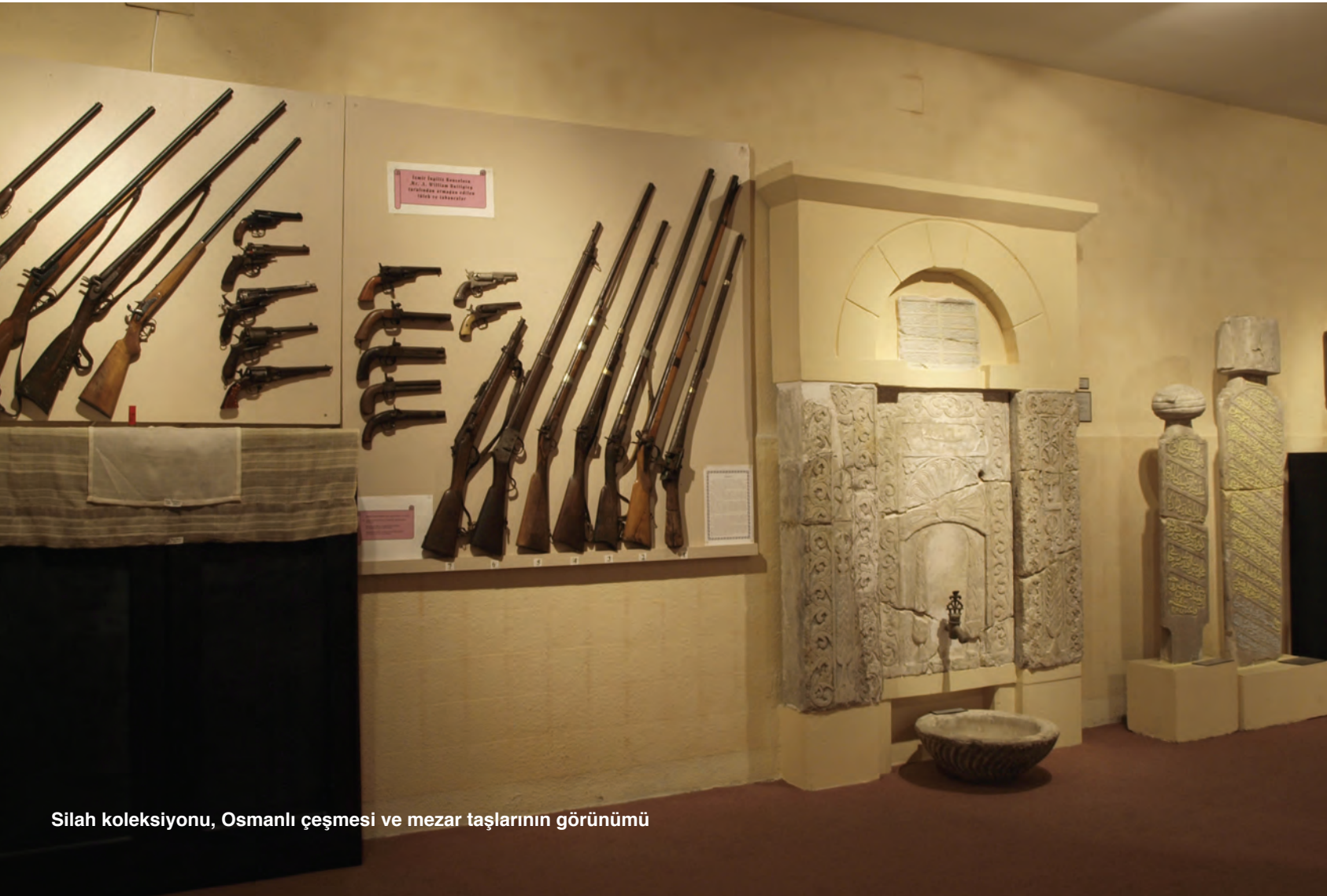
Silah koleksiyonu, Osmanlı çeşmesi ve mezar taşlarının görünümü