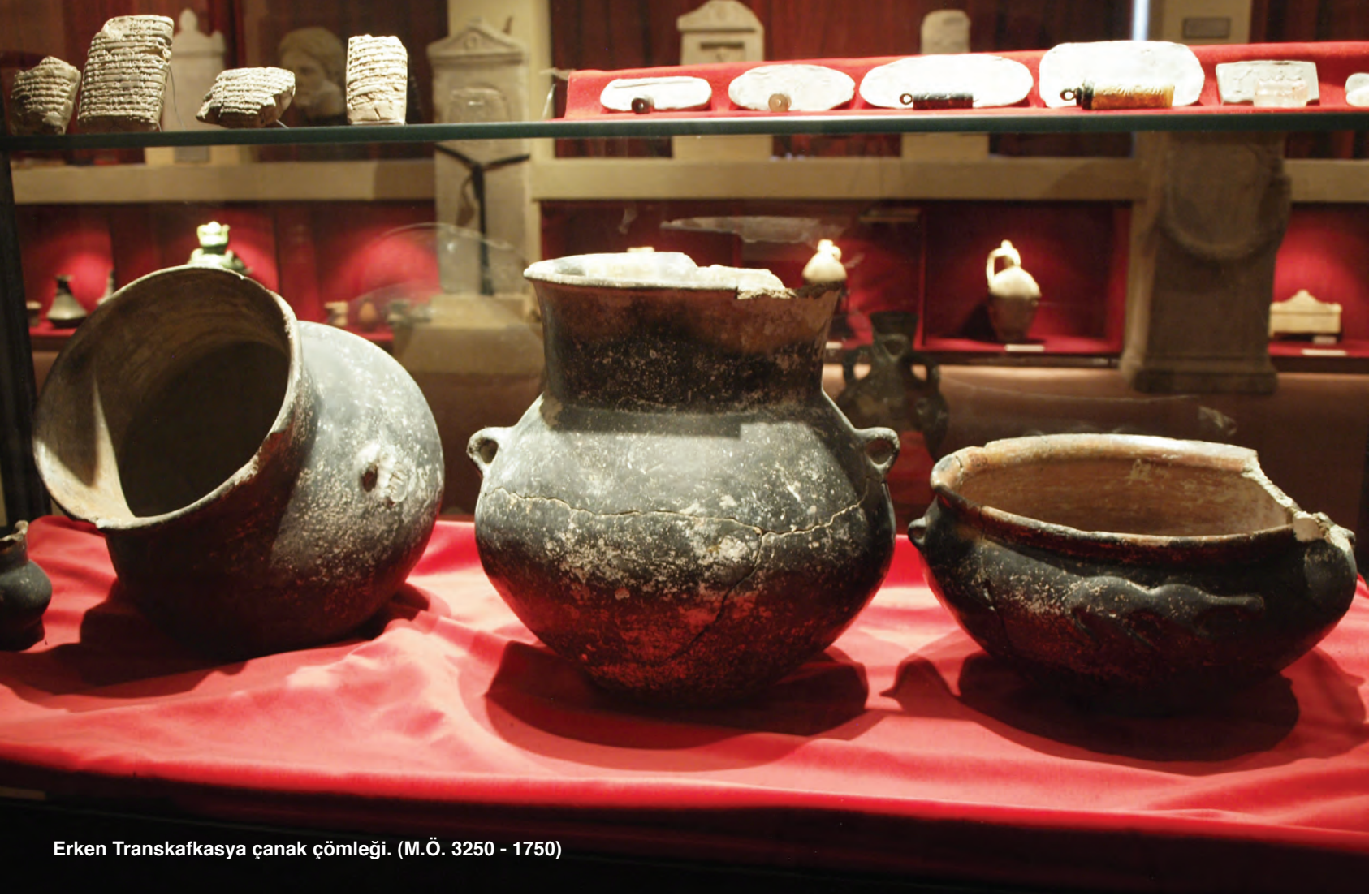
Erken Transkafkasya çanak çömleği. (M.Ö. 3250 - 1750)