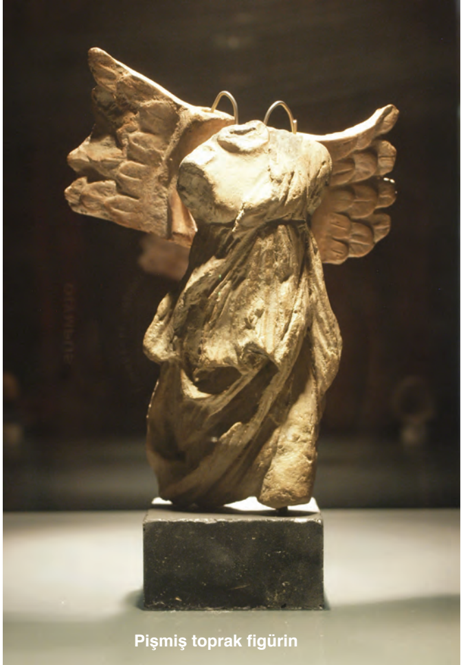
Pişmiş toprak figürin

Bu çalışmalar sonucunda, E.Ü. Edebiyat Fakültesi Eski Eser Koleksiyonu, İzmir Arkeoloji