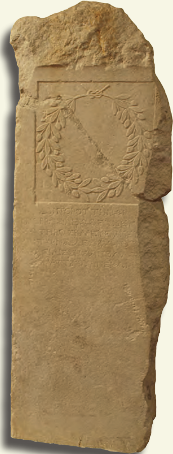
Zeus Porottenos'a Adak Steli. [M.Ö. 183-159; Iulia Gordos (Gördes); mermer; 48.5 x 154 x 16 cm; Bilgin Büke armağanı]

“ Mysialıların önderi, Attinas oğlu Kleon (bu adağı), kurtarıcı ve iyiliksever Kral Eumenes ve onun kardeşleri ile Kraliçe Apollonis için Zeus Porottenos'a (sundu).”