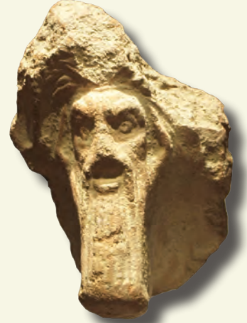
Erkek başı (pişmiş toprak)