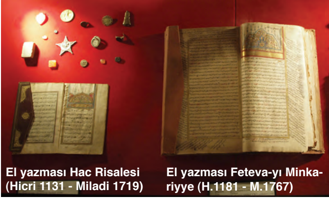
El yazması Hac Risalesi (Hicri 1131 - Miladi 1719)