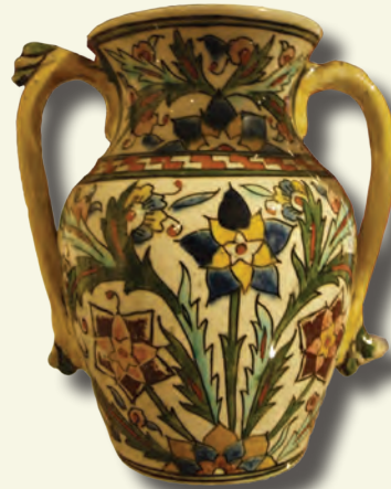
Kütahya seramiği örneği (18. Yy.)