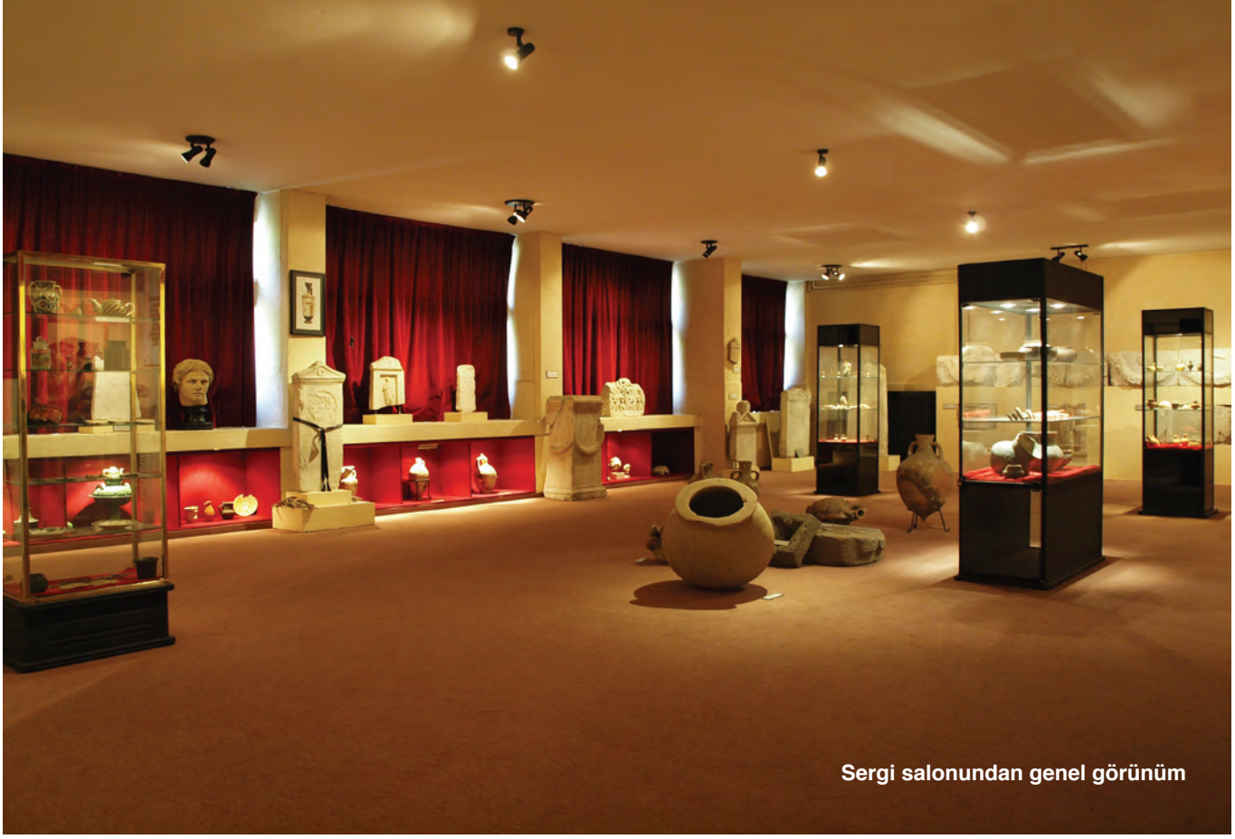
Sergi salonundan genel görünüm

Müzesi Müdürlüğünden alınan 24.11.1995 tarih ve 1411 sayılı koleksiyonerlik belgesi ile, 1995 yılında resmiyet kazanmıştır.