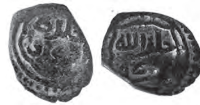
İshak Bey sikkesi