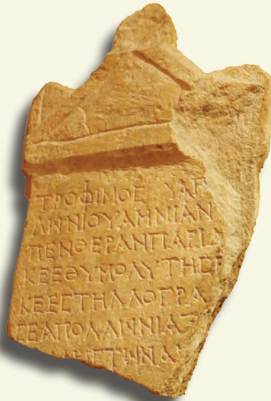
Apollon Aksyros'a Kefaret Yazıtı. (Roma İmp. Devri; mermer, 24 x 39 x 4.5 cm; Demirci - Saraycık)

“Apollonios oğlu Trophimos, kaynanası Ammia'yı aşağıladı (ve Tanrı'yı) kızdırdı. Ama şimdi Tanrı'nın öfkesini yatıştırdı ve yazılı bir adak taşı hazırladı ve onu Apollon Aksyros'a şükrederek sundu.”