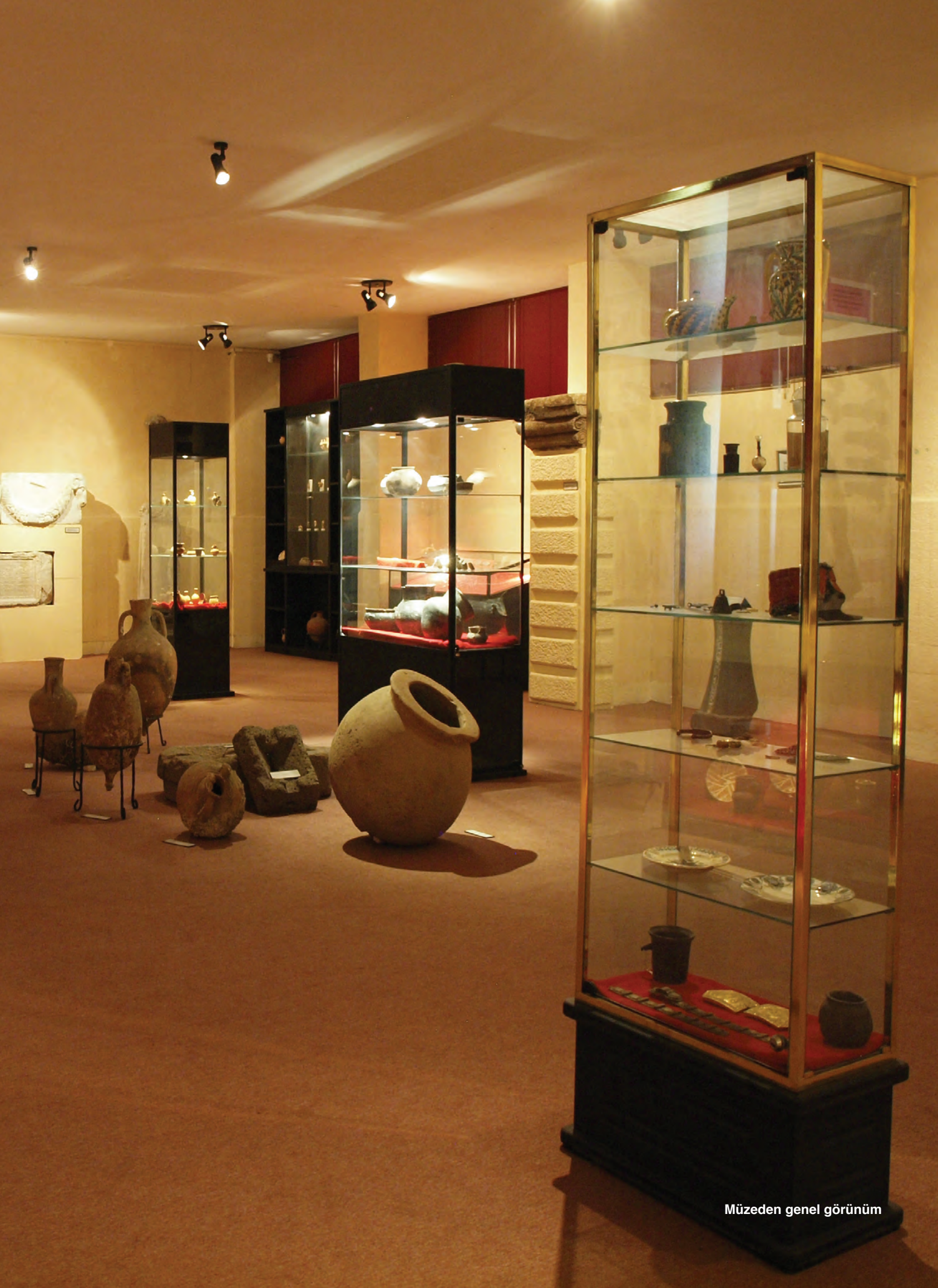
Müzeden genel görünüm