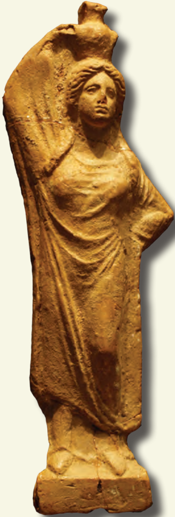
Kadın figürini (pişmiş toprak)