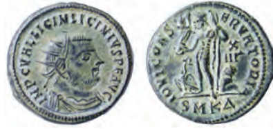
I. Licinius sikkesi