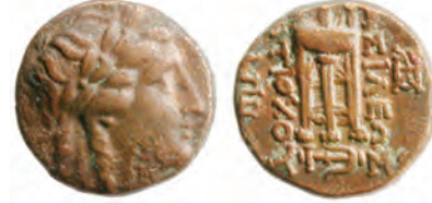
II. Antiokhos sikkesi