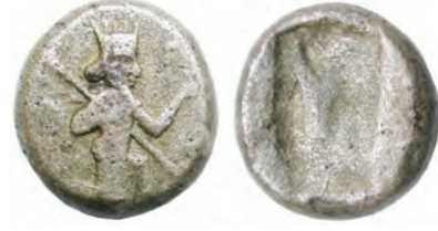
Pers Krallığı sikkesi

Etnografik eserler arasında ise, mermer Osmanlı çeşmesi, mermer çeşme ve yapı yazıtları, mezar taşları, Kütahya ve Çanakkale seramiği örnekleri, tüfek ve tabancalar, Selçuklu, Beylikler ve Osmanlı dönemlerine ait sikke örnekleri bulunmaktadır.