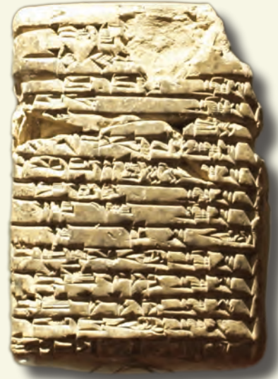
Çiviyazılı tablet. (M.Ö. 2.-1. Bin)