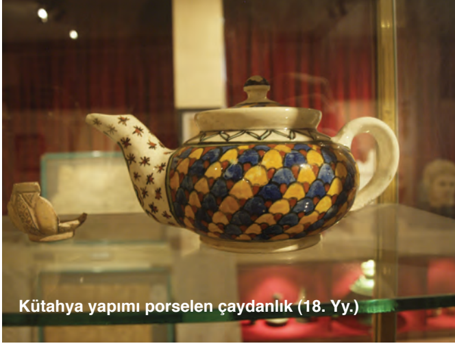
Kütahya yapımı porselen çaydanlık (18. Yy.)

toprak tabletler, Grekçe yazıtlı mermer adak ve mezar stelleri, mermer mimari parçalar, silindir mühürler, pişmiş toprak figürinler, pişmiş toprak Erken Transkafkasya ve değişik dönemlere ait çanak-çömlekler, amphoralar ile Grek, Roma ve Bizans sikke örnekleri sayılabilir.